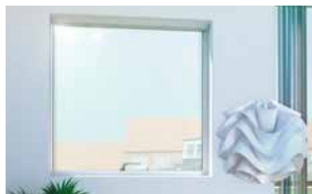
➤ Smal ramme giver større lysindfald

Selve rammen er desuden forsynet med indbrudsforebyggende beslag. Hos VELFAC anvender vi ikke standardbeslag, men fremstiller selv alle vores beslag - og de er udviklede til de enkelte vinduesserier.