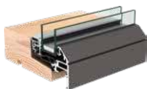
➤ VELFAC Edge karmudsnit

VELFAC Edge leveres med 2-lags rude og er B-mærket. Med aluminium på ydersiden, som blot kræver minimal vedligeholdelse - og malet træ på indersiden får du et vindue, der holder i både form, funktion og udtryk.