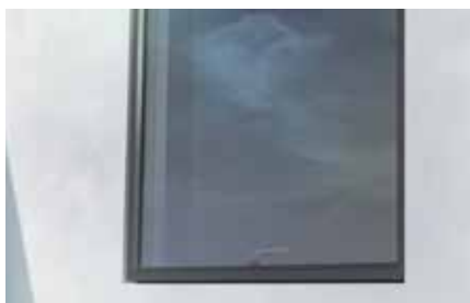
➤ Tilbagelagt fuge for en svævende ramme