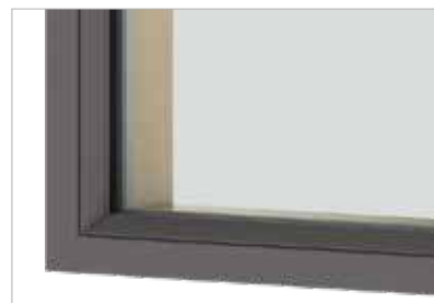
➤ Indvendig glasliste som indbygget sikkerhed